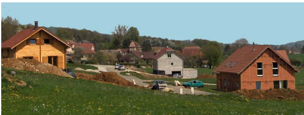
Trois maisons sont sorties de terre...

« Huit parcelles du lotissement sur dix sont aujourd'hui vendues. »