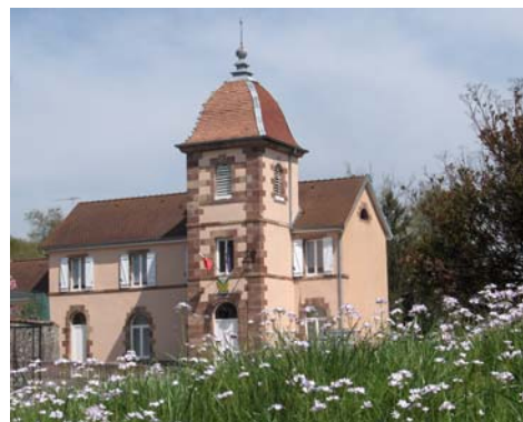
Rénovation de la façade de la Mairie

Renseignements : HRU/Développement-Conseils 2 Place du moulin des Prés - BP 317 - 70006 VESOUL 03 84 75 94 43 - HRU@wanadoo.fr Permanence à Héricourt tous les 1 ers jeudis de chaque mois.