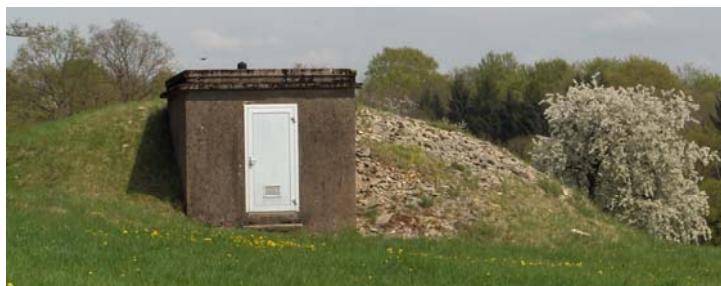
Château d'eau de Trémoins

Le projet retenu par le Syndicat des Eaux consiste à construire un nouveau château d'eau de 300 m 3 à une altitude de 425 mètres qui desservira par des réseaux séparés Trémoins et Verlans / Byans soit un gain de deux bars. L'étude a été confiée à la Société André de Pontarlier qui devra remettre un dossier de consultation destinée aux appels d'offre, base de la phase finale qui sera la recherche du financement.